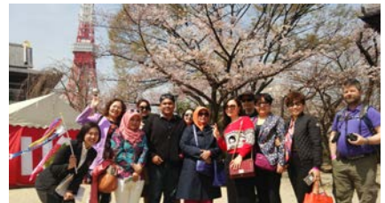
2016年Ohanami Walkの様子 ※昨年は芝パークホテルで実施